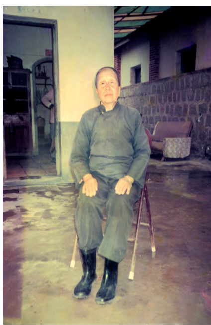
尋找許久，這是祖母留下的唯一照片。

對身邊出生于上世紀60年代前的人們提起“南洋”，他們似乎都能說出一番故事。我家與南洋也有過一段特殊的情緣。