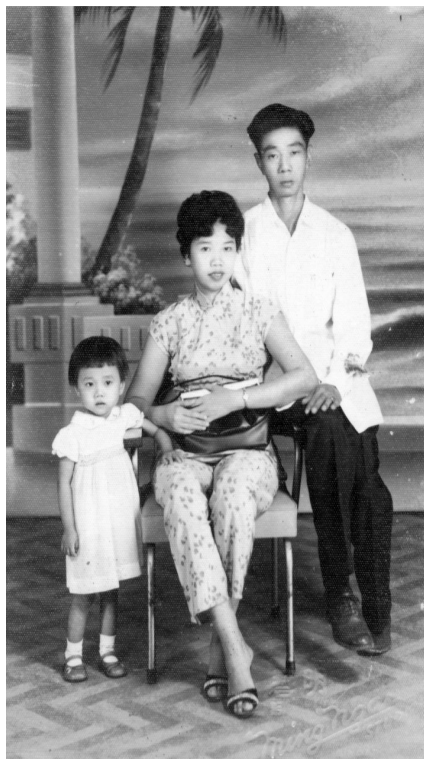
多年前，舅公將全家福寄回了國。